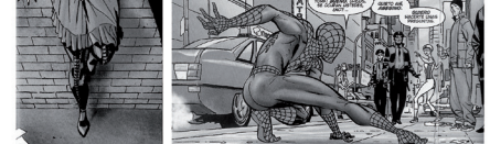
Punto de vista contrapicado