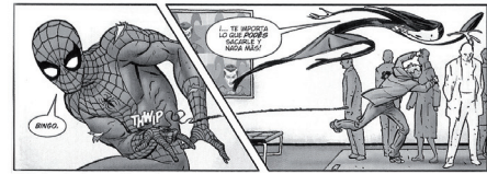
Viñetas de formas irregulares