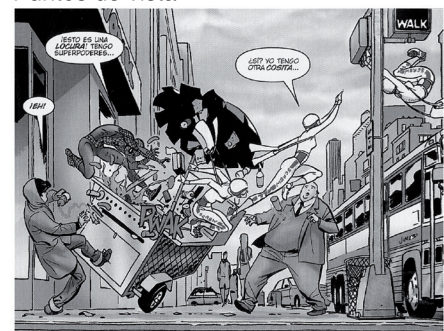
Punto de vista Horizontal